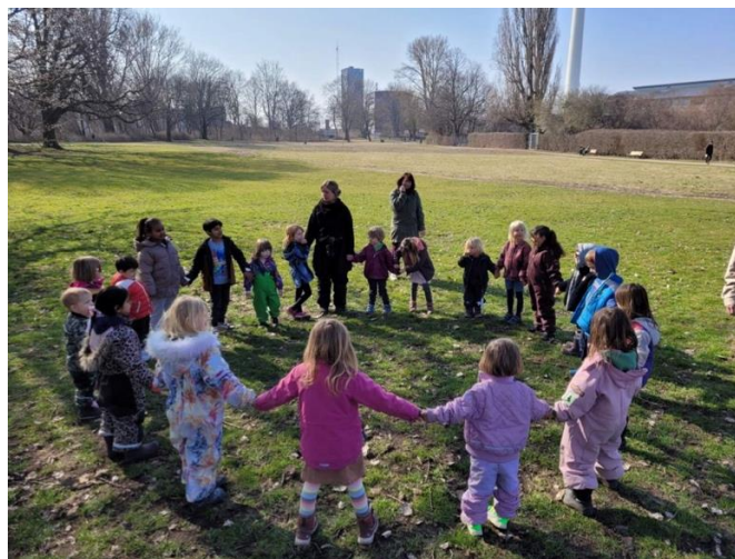
På tur i nærområdet. Sociale lege i Lersøparken ved Bispebjerg Bakke

Vi tilbyder alle børn fuld forplejning. Maden er vegetarisk inkl. fisk, og vi har en økologiprocent på ca. 97 %.