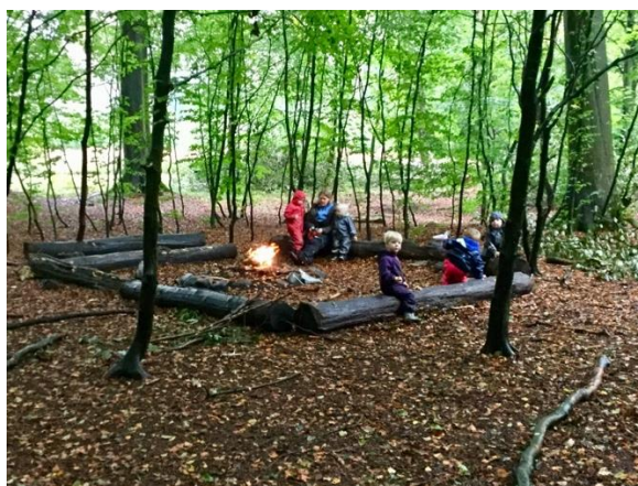
Hyggelig tur i skoven

Vi vil gerne kunne tilbyde en hverdag, hvor vi i fællesskab med forældrene, skaber de bedst mulige rammer for det gode børneliv. Hvor der både er plads til omsorg, fordybelse og nærvær, men også spontanitet, skøre indfald og den kreative leg. Her skal der være mulighed for at øve sig, lave fejl og gøre sig egne erfaringer. I Røde Rose skal man have lov til "at blive til sig selv" i trygge og anerkendende rammer.