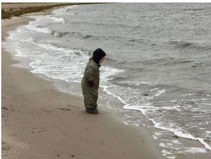
Tur til vandet

Vi taler gerne med forældrene om, hvorfor det er vigtigt at have en glæde ved at bruge sin krop. Vi kommer gerne med gode forslag til aktiviteter, som stimulerer barnets bevægelsesglæde. Vi har desuden mulighed for at få sparring af en speciel uddannet motorik sundhedsplejerske, hvis vi har børn der har motoriske udfordringer.