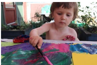
Maleaktivitet på legepladsen

Børnene skal også være med skabere af kulturen i huset. Ligesom de skal have mulighed for at præge aktiviteterne og hverdagen, skal de også være med til at sætte deres præg på udsmykningen. Vi pynter op så det passer til årstiderne og højtiderne, med børnenes egne værker og hjemmelavet pynt.