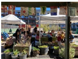
Forældrekafe på legepladsen

Vi holder desuden samtaler ved behov. Disse samtaler kan være på foranledning af os eller forældrene. Vi har også mulighed for at inddrage andre faggrupper i samarbejdet, hvis det er aktuelt.