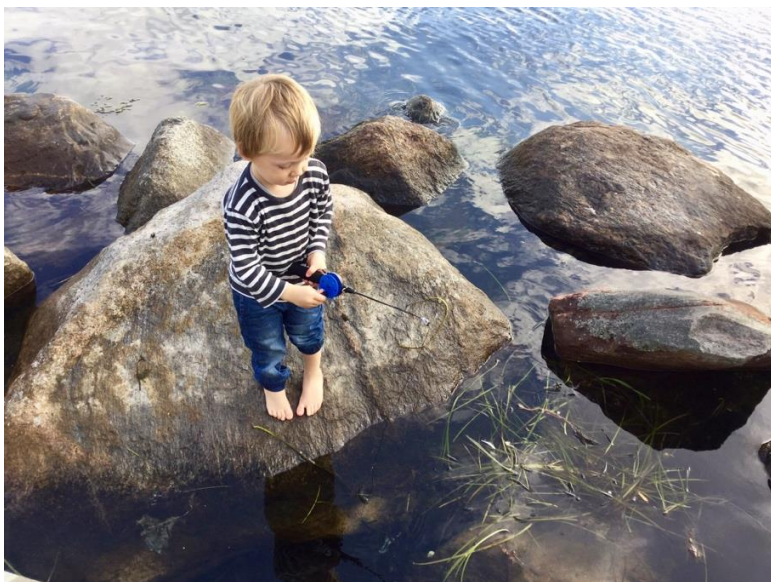
Krabbefiskeri ved Svanemøllen

Børn har for det meste en naturlig glæde ved at være i uderummet. Vi oplever indimellem børn, som af forskellige årsager ikke kan lide at være ude. Her må vi være nysgerrige, er aktiviteterne/turene alderssvarende? Er påklædningen i orden? Eller er barnet utryk i omgivelser som kan være uvante? Her er det vores ansvar at tilrettelægge aktiviteterne og turene, så alle børn kan få en positiv oplevelse i og af uderummet. Den mest succesfulde måde at inddrage forældrene på er via fotos og fortællinger fra dagen. Foto giver et fantastisk udgangspunkt for en dialog med forældrene om, hvad det er, man kan med børn i naturen. At det er den oplagte legeplads, at bevægelse sker helt af sig selv, at man sagens kan lave bål eller sove til middag i skoven, at det er sjovt at se på smådyr, og finde ud af senere hvad de hedder. At naturen skaber rammer for nærvær i en ellers travl hverdag.