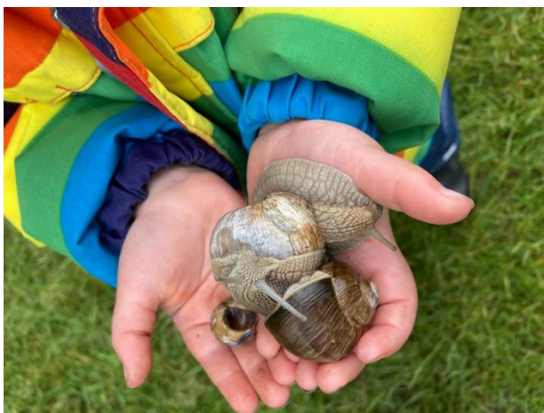
Sneglejagt i Skolehaverne

Med en beliggenhed på Nørrebro har vi et utal af muligheder for forskellige aktiviteter rettet mod børn. Vi er flittige bruger af de omkringliggende parker og legepladser. Vi kan besøge museer eller tage en tur ind til byen. Vi har tog, bus og metro indenfor kort afstand, og har derved også gode muligheder for at komme rundt omkring. Vi har et enestående samarbejde med Skolehaverne ved Bispebjerg Bakke, hvor vi alle kommer året rundt. Vi deltager i specielt tilrettelagte forløb for både vuggestue- og børnehavebørn, men benytter også de enestående rammer på egen hånd.