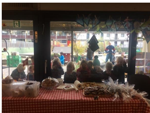
Bag for Børnetelefonen 2019

Vi snakker med forældrene om vigtigheden i at inkludere alle børn når de snakker derhjemme, samt omtale andre børn med respekt. At man hilser på alle børn på stuen og ikke kun udvalgte. Børn gør ikke hvad vi siger, men derimod hvad vi selv gør. Vi opfordrer også forældrene til at hjælpe nye forældre ind i fællesskaber i og uden for institutionen.