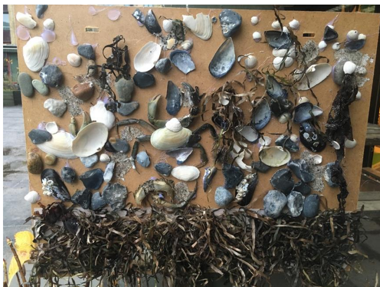
Skaller samlet på stranden